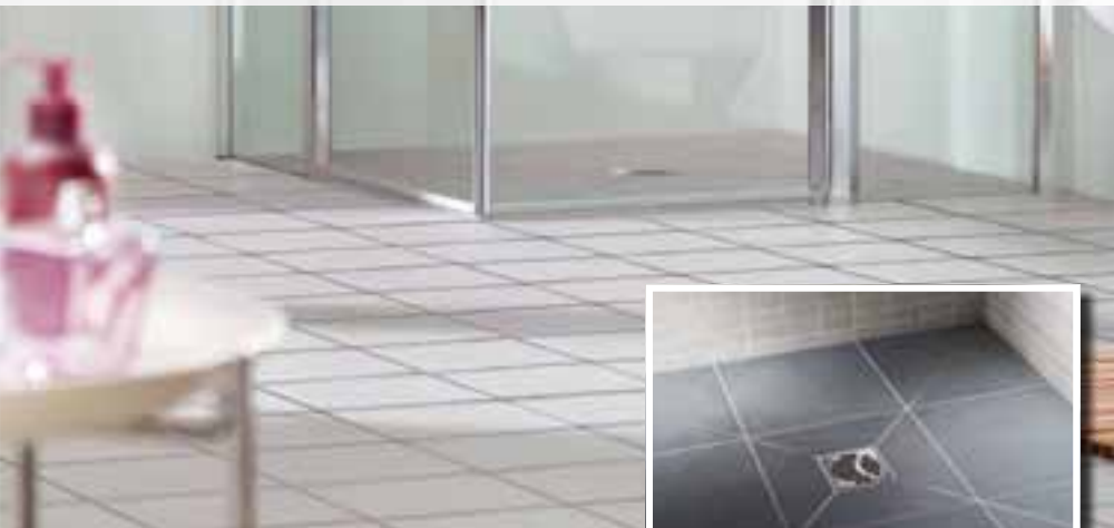
Abb. rechts oben: Der OPTIMA S Standardrost aus Edelstahl liegt jedem Ablauf bei.

Abb. rechts: An Stelle des Standardrosts kann optional der OPTIMA S Designrost (links) oder der Designrost Quadrato (rechts) eingesetzt werden (Maße jeweils 95 x 95 x 4 mm, beide aus massivem Edelstahl).