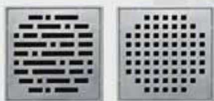
Abb. unten: Auch beim Duschboard Superflach kann der Standardrost gegen den passenden OPTIMA S Designrost (links) oder den Quadrato Designrost (rechts) ausgetauscht werden (Maße jeweils 120 x 120 x 4 mm, beide aus massivem Edelstahl).

Diese Duschboard-Variante ist bestens für die Bad-Renovierung geeignet, denn sie ist extrem flach: Mit einer minimalen Aufbauhöhe von 7,0 cm (bei einer Abmessung 90 x 90 cm) ist das OPTIMA S Duschboard Superflach die ideale Lösung, wenn es darum geht, bodenbündige Duschelemente in den Bestandsbau zu integrieren.