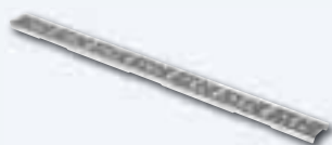
OPTIMA Designrost gerade, Edelstahl poliert