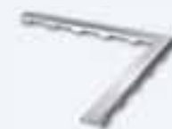
OPTIMA Designrost „steel II“, Winkel 90°, Edelstahl poliert