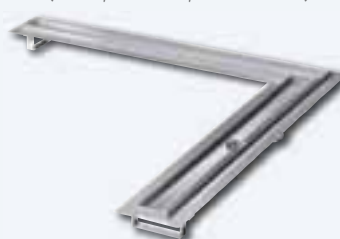
OPTIMA Fliesenmulde, Winkel 90°, Edelstahl

*Angabe ist die reale Rinnenlänge und -breite; sichtbare Maße sind eingeklammert aufgeführt. Die Maße für die geraden Einsätze entsprechen den jeweiligen Rinnenlängen.