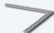
OPTIMA Designrost, Winkel 90°, Edelstahl poliert